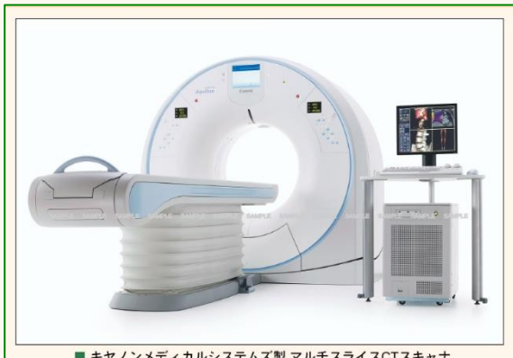
■ キヤノンメディカルシステムズ製 マルチスライスCTスキャナ