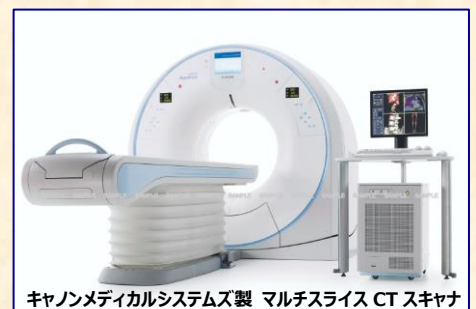
キャノンメディカルシステムズ製 マルチスライス CT スキャナ