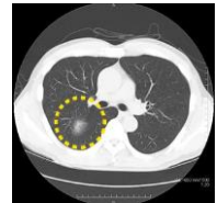
胸部 CT 写真

胸部 X 線では見えない影が胸部 CT でははっきりと見えています。CT 検査は胸部 X 線写真の弱点を補い肺がんの発見率を上昇させます。